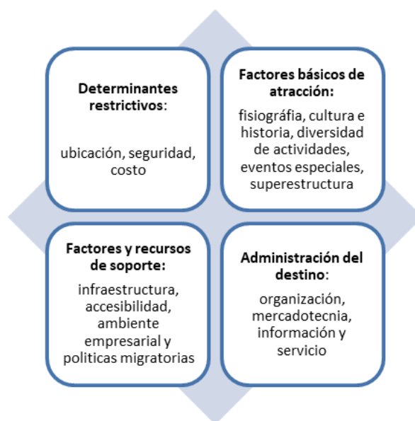
Figura 1. Modelo de competitividad turística de Crouch y Ritchie

Asimismo, Crouch y Brent Ritchie (1999) definen a la competitividad turística como «la capacidad de un país para crear valor añadido e incrementar, de esta forma, el bienestar nacional mediante la gestión de ventajas y procesos, atractivos, agresividad y proximidad, integrando las relaciones entre los mismos en un modelo económico y social» (p. 144). Del concepto anterior, se identifica que son diversos los factores que influyen para hacer a un destino más competitivo, modelo que Ibáñez Pérez (2011) aprovecha para determinar dichos factores para la competitividad del Sector Turístico en México (ver Figura 1).