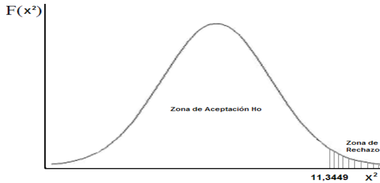
Figura 1. Dispositivos tecnológicos e interactividad virtual