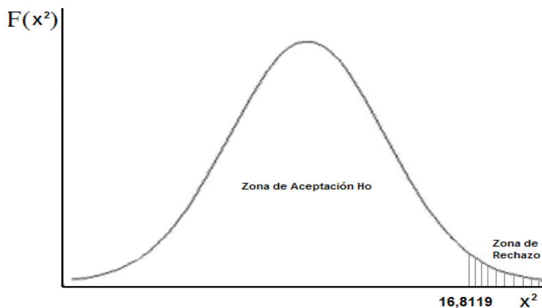
Figura 4. Interactividad en lo multidisciplinario

Para llevar a cabo trabajos multidisciplinarios y alcanzar aprendizajes significativos, los docentes se sienten en la necesidad de adquirir competencias tecnológicas y comunicativas a nivel específico. Razón por la cual, en la Figura 4 se puede apreciar que la mayoría de los educadores se apoyan más en el uso de herramientas convencionales que las que ofrece la web 3.0 al momento de respaldar el proceso formativo. Además de lo anterior, se apoyan en métodos convencionales o empíricos de seguimiento al instante de valorar las TIC que utiliza para potenciar la praxis pedagógica.